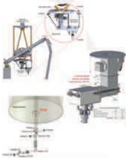
Optica y estructura mecánica