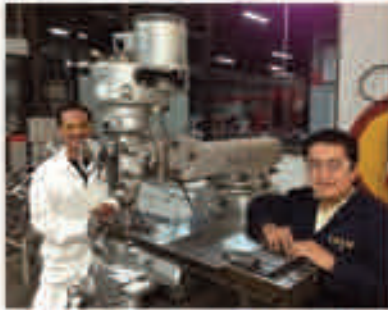
Cabinets prototypes for system functional tests